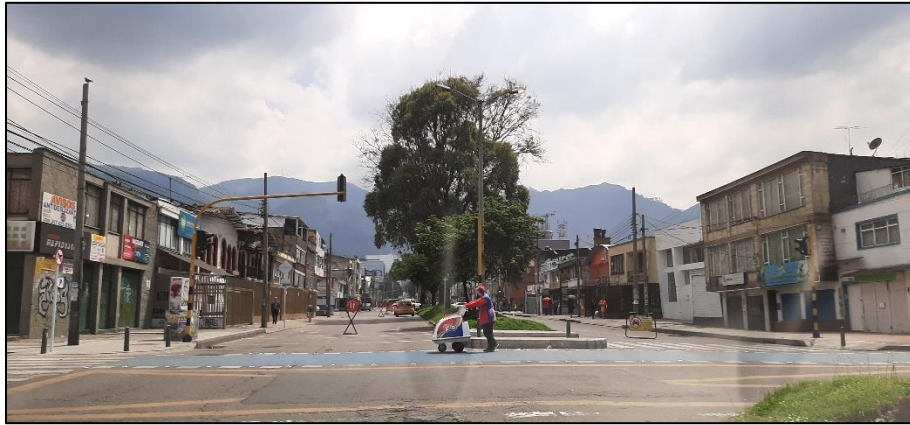
Figura 1-7. Av. Chile a la altura de la Carrera 20.