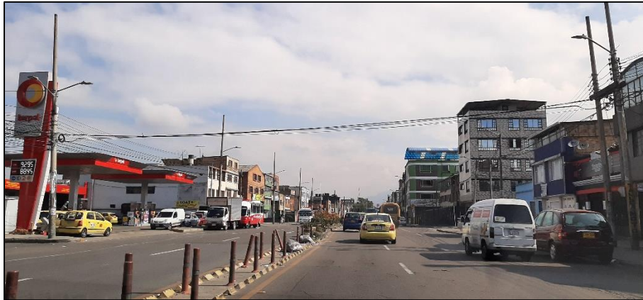
Figura 3-7. Av. Mariscal Sucre a la altura de la Calle 8 Sur.