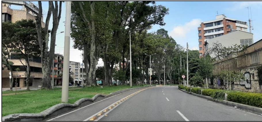
Figura 3-10. Av. Mariscal Sucre a la altura de la Calle 36.