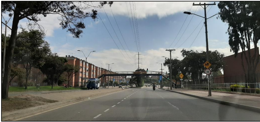
Figura 3-1. Av. Mariscal Sucre a la altura de la Calle 50 Sur.