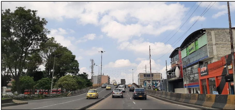
Figura 4-2. Av. José Celestino Mutis a la altura de la Avenida NQS.