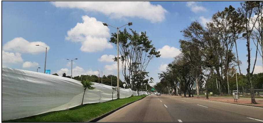
Figura 4-4. Av. José Celestino Mutis a la altura de la Carrera 60.