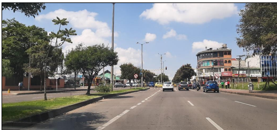
Figura 4-6. Av. José Celestino Mutis a la altura de la Carrera 77. Fuente: Elaboración propia