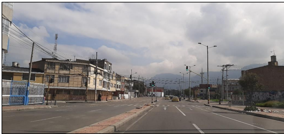
Figura 3-8. Av. Mariscal Sucre a la altura de la Calle 3.