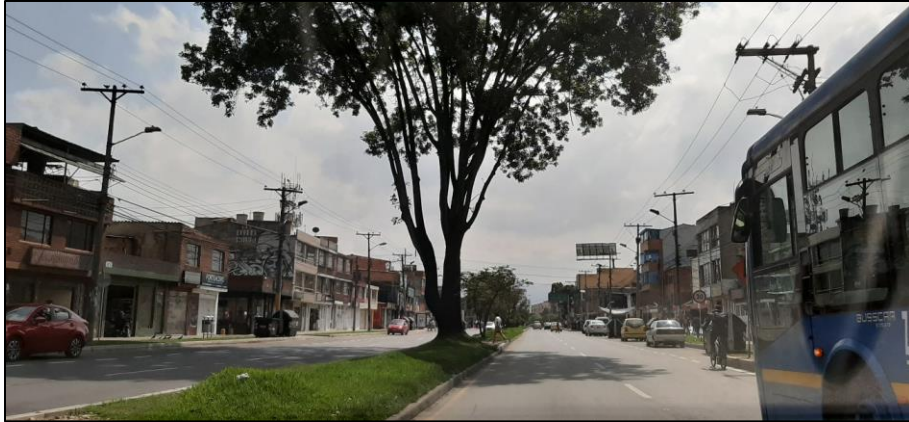
Figura 1-1. Av. Chile a la altura de la Carrera 105.