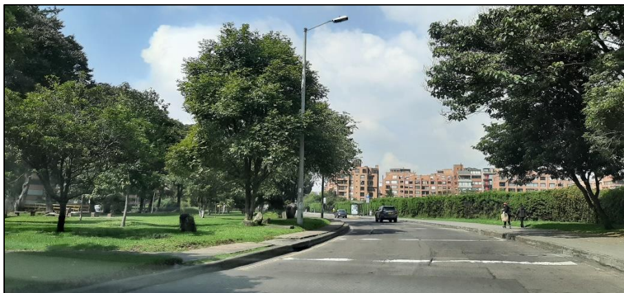
Figura 5-3. Av. Rodrigo Lara Bonilla a la altura de la Carrera 11.