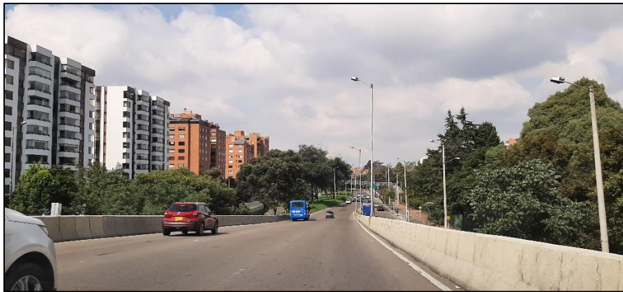
Figura 5-2. Av. Rodrigo Lara Bonilla a la altura de la Carrera 9.