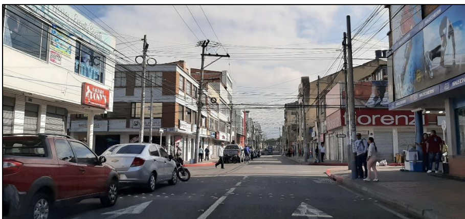
Figura 3-6. Av. Mariscal Sucre a la altura de la Calle 17 Sur.