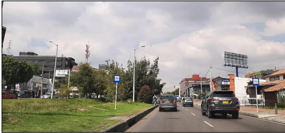
Figura 5-4. Av. Rodrigo Lara Bonilla a la altura de la Carrera 19.