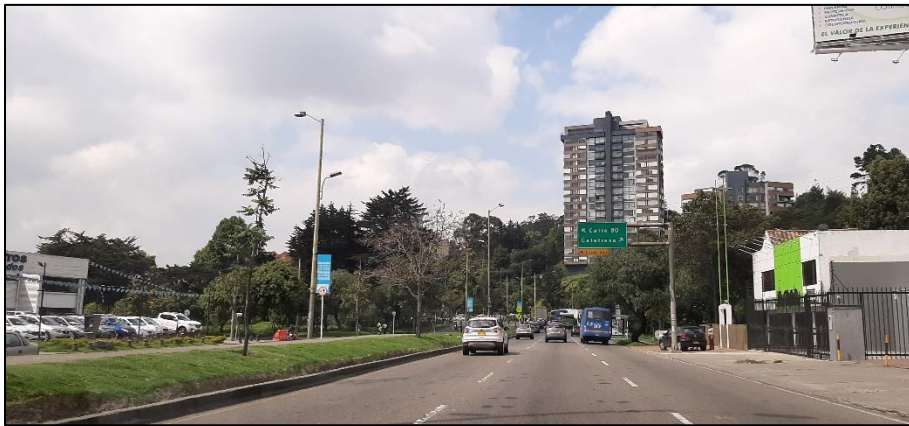
Figura 5-8. Av. Rodrigo Lara Bonilla a la altura de la Carrera 70.