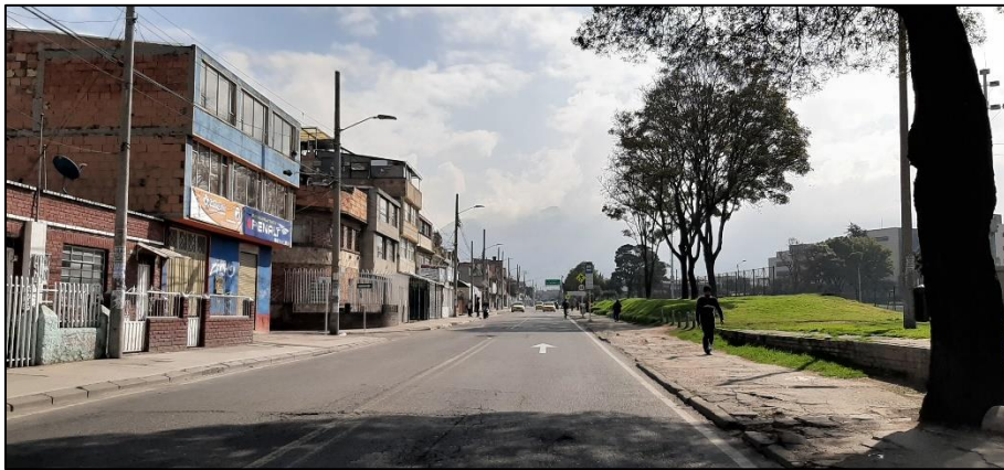
Figura 3-5. Av. Mariscal Sucre a la altura de la Calle 23 Sur.