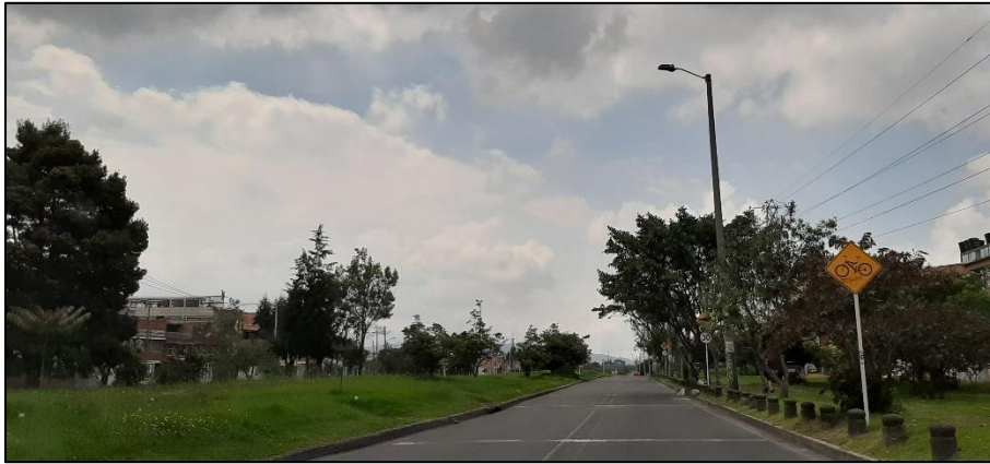
Figura 2-4. Av. Ferrocarril del Sur a la altura de la Calle 20 Sur.