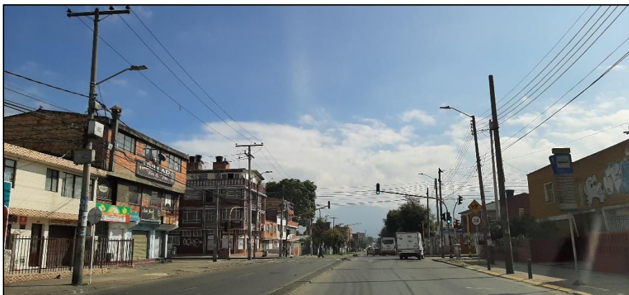
Figura 3-3. Av. Mariscal Sucre a la altura de la Calle 31 Sur. Fuente: Elaboración propia