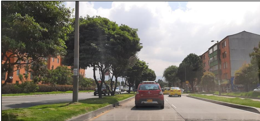
Figura 1-2. Av. Chile a la altura de la Carrera 90.