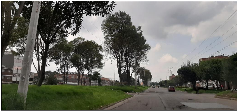
Figura 2-1. Av. Ferrocarril del Sur a la altura de la Calle 6.