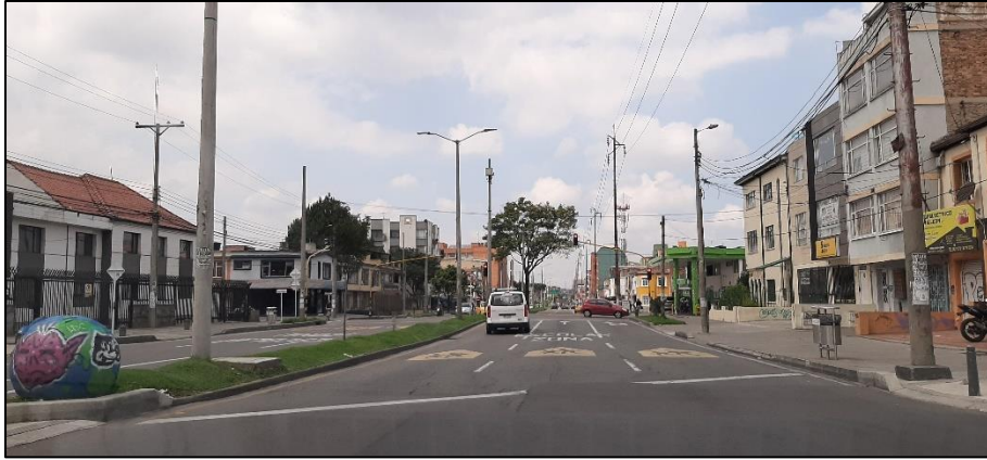
Figura 4-1. Av. José Celestino Mutis a la altura de la Carrera 15.