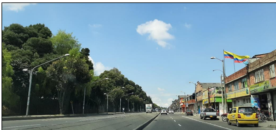
Figura 4-9. Av. José Celestino Mutis a la altura de la Carrera 106.