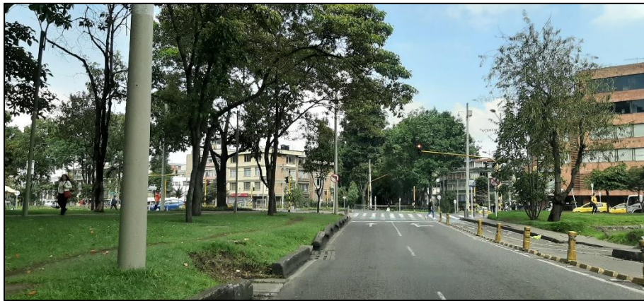
Figura 3-11. Av. Mariscal Sucre a la altura de la Calle 45.