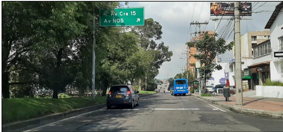
Figura 5-1. Av. Rodrigo Lara Bonilla a la altura de la Carrera 9.