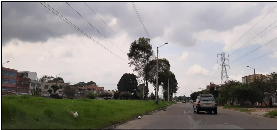
Figura 2-2. Av. Ferrocarril del Sur a la altura de la Calle 3.