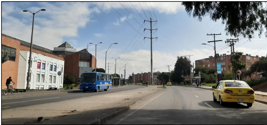
Figura 3-2. Av. Mariscal Sucre a la altura de la Calle 47 Sur.