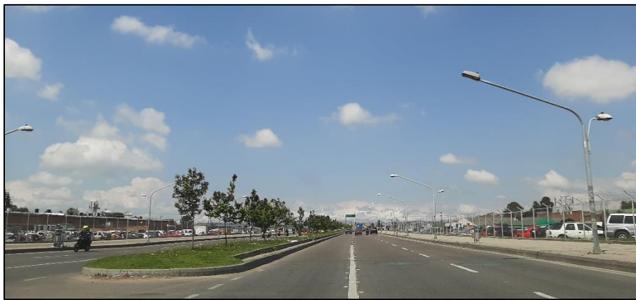
Figura 4-8. Av. José Celestino Mutis a la altura de la Carrera 90.