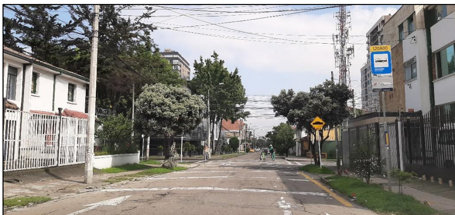
Figura 3-9. Av. Mariscal Sucre a la altura de la Calle 31.