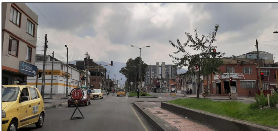
Figura 1-6. Av. Chile a la altura de la Carrera 28.