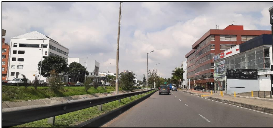
Figura 5-5. Av. Rodrigo Lara Bonilla a la altura de la Carrera 21.