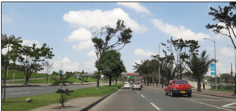
Figura 4-3. Av. José Celestino Mutis a la altura de la Carrera 50.