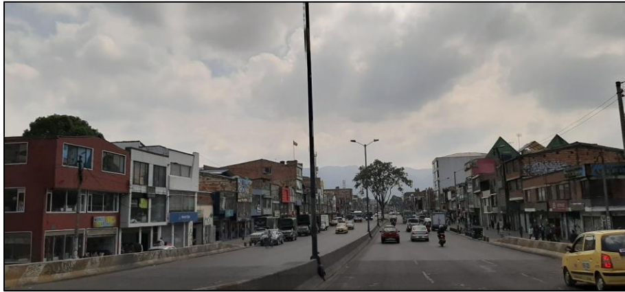
Figura 1-4. Av. Chile a la altura de la Carrera 71.