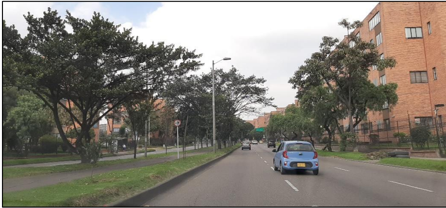
Figura 5-7. Av. Rodrigo Lara Bonilla a la altura de la Carrera 57.