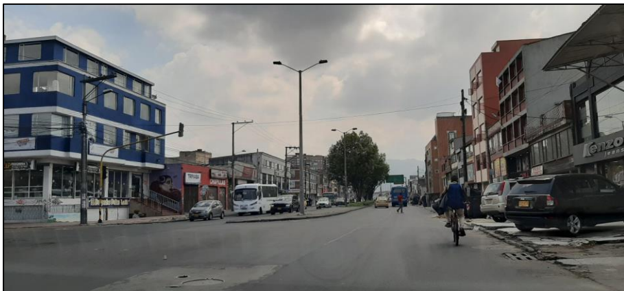
Figura 1-3. Av. Chile a la altura de la Carrera 76.