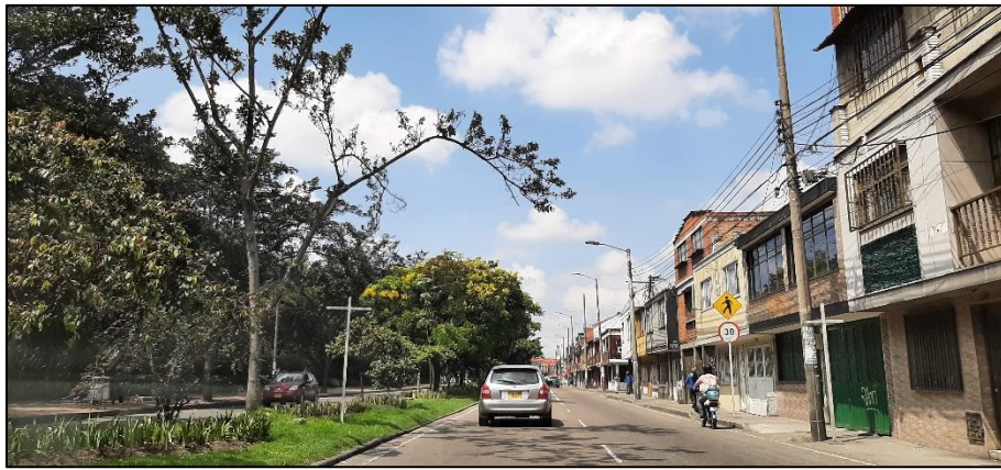
Figura 4-5. Av. José Celestino Mutis a la altura de la Carrera 70.