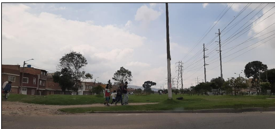
Figura 2-6. Av. Ferrocarril del Sur a la altura de la Calle 30 Sur.