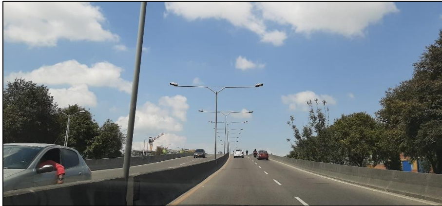
Figura 4-7. Av. José Celestino Mutis a la altura de la Avenida Ciudad de Cali.