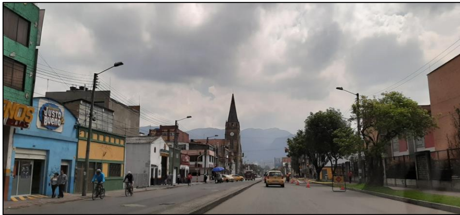
Figura 1-5. Av. Chile a la altura de la Carrera 57.