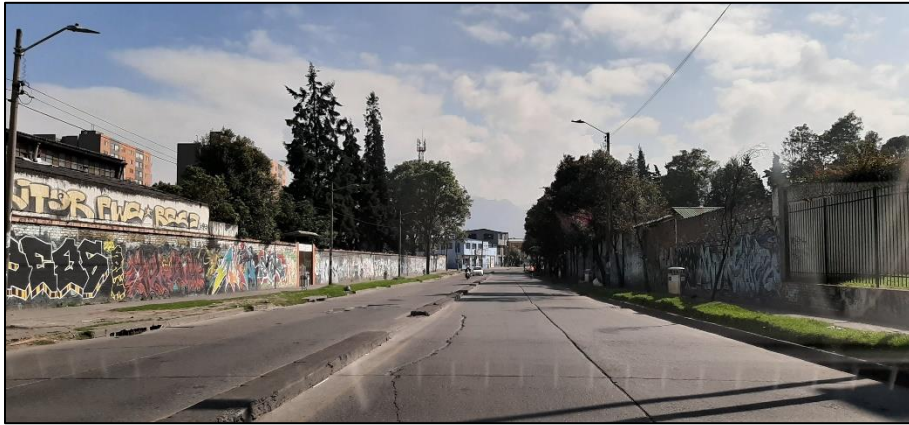
Figura 3-4. Av. Mariscal Sucre a la altura de la Calle 29 Sur.