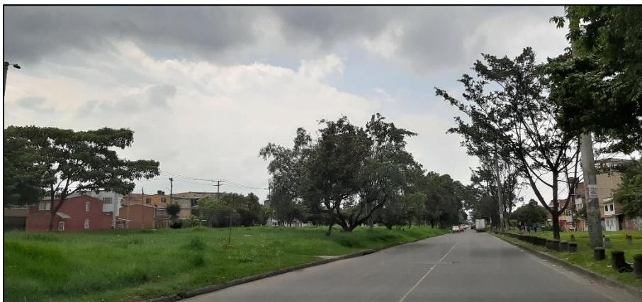
Figura 2-3. Av. Ferrocarril del Sur a la altura de la Calle 2.