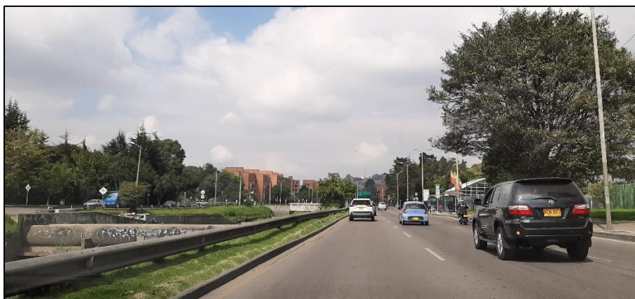
Figura 5-6. Av. Rodrigo Lara Bonilla a la altura de la Carrera 54.