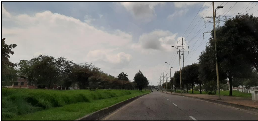
Figura 2-5. Av. Ferrocarril del Sur a la altura de la Calle 24 Sur.